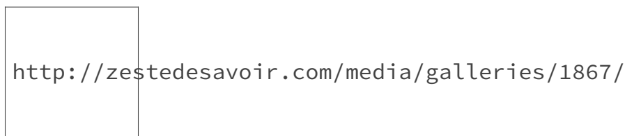
FIGURE 3.1. – Un exemple de voisinage de la droite complexe

Sur l'image qui suit, un voisinage de a \in \mathbb{C} a été représenté. La zone la plus foncée représente une boule ouverte centrée en a contenue dans V_a ce qui permet bien de qualifier ce dernier de voisinage de a .