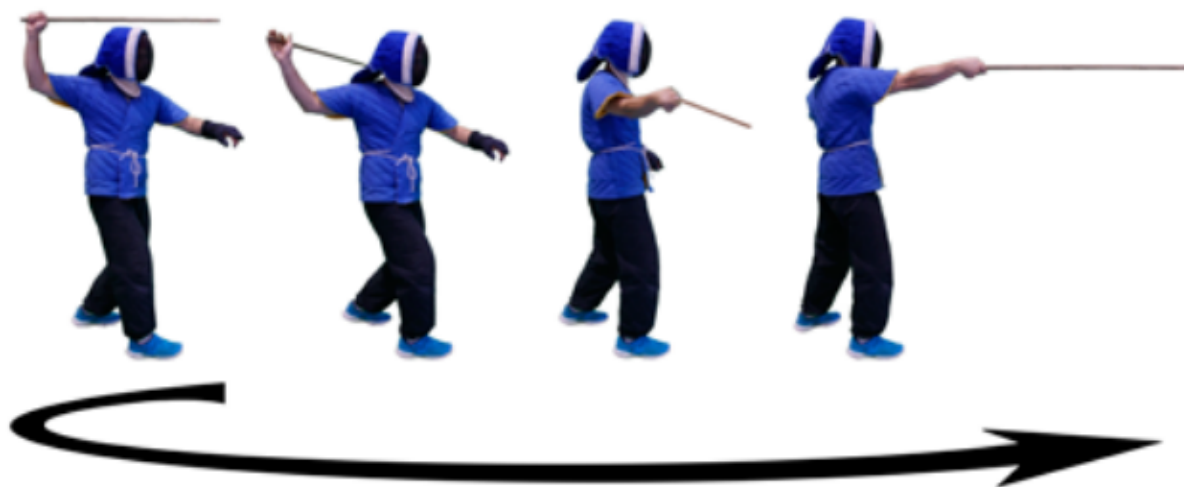
FIGURE 5.2. – Le latéral extérieur, tiré du cahier de canne ↗ .