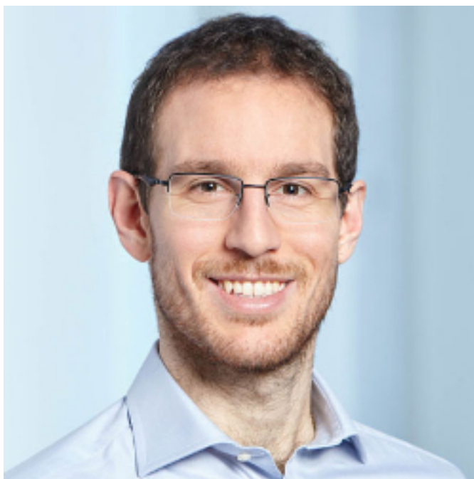
FIGURE 2.4. – Portrait d'Alessio Figalli.

En particulier, Alessio Figalli travaille sur le transport optimal ↗ , qui lui a valu sa médaille Fields. Pour ceux que les mondanités intéressent, vous serez sûrement curieux d'apprendre qu'un de ses directeurs de thèse n'est autre qu'un des mathématiciens français les plus connus du grand public, Cédric Villani ↗ , également médaillé Fields (en 2010).