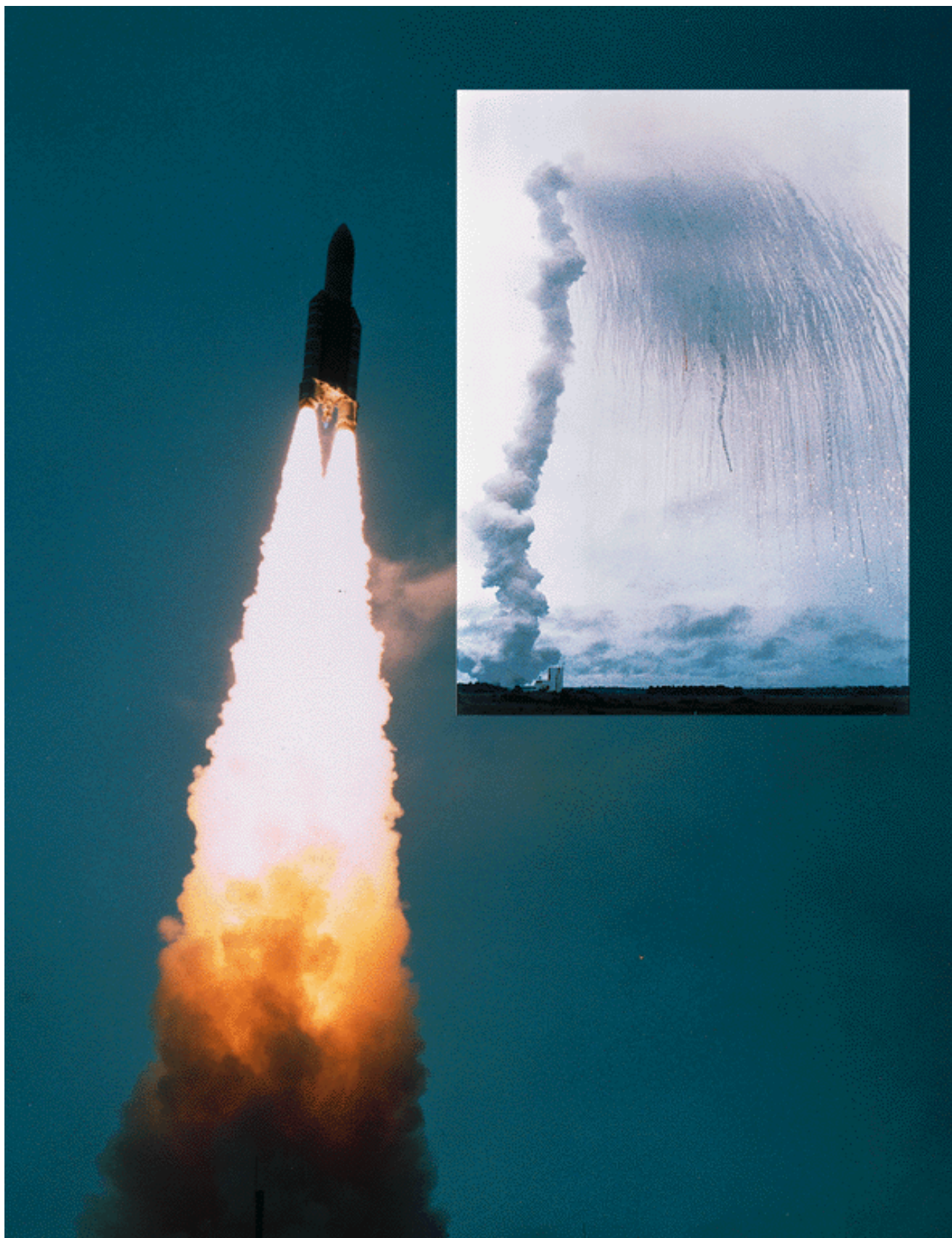
FIGURE 3. – Parce qu'un bug peut être très gênant.

Et c'est aussi là que les autres gros travaux commencèrent pour le moteur de recherche, l'interface de rédaction, etc. Si on ajoute l'indisponibilité de gustavi (qui, derrière ce spaceinvader cache