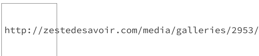
FIGURE 3. – Carte des provenances des visiteurs de Zeste de Savoir

Le reste du top 10 est par contre pas mal chamboulé, avec dans l'ordre le Maroc, la Tunisie, le Royaume-Uni, l'Algérie, l'Allemagne et la Réunion. Zeste de Savoir a reçu des utilisateurs de 169 pays différents, autant dire que ça devient difficile de repérer les pays où personne n'est jamais allé sur Zeste de Savoir!